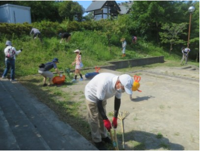
道路公園センターに、側溝清掃&整地していただきました