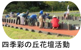
四季彩の丘花壇活動

公園の花を育てたり、一緒に作業してくれる仲間を募集しています♪ 会員にならなくても大丈夫です。 都合の合う時間に参加していただければOKです。