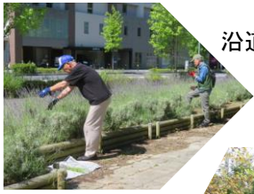
沿道のラベンダー