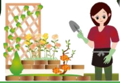
ふるさと緑地の菊