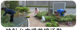
時計台広場花壇活動