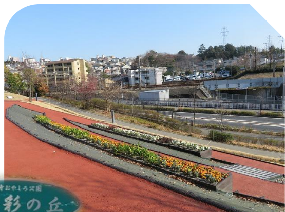
↑万福寺おやしる公園