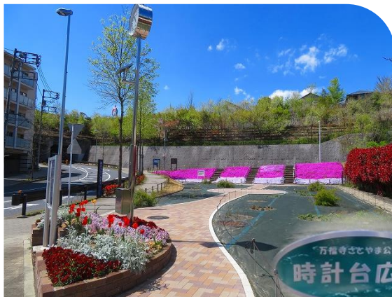
↓万福寺さとやま公園