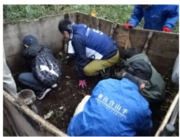
土を丁寧に掘り起こし