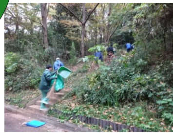
緑地の中へGO!寝床へつづく...