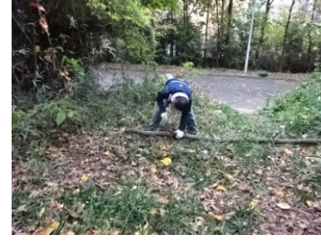
宙ぶらりん枝をカット...