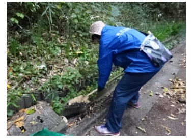
側溝の土も寝床へ...