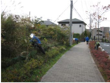
ふるさと緑地の除草作業