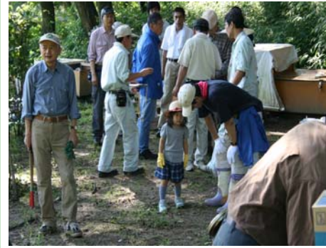
さとやま公園での除草